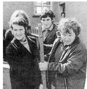
Yma o Hyd?

Rhiw, Llanestyn, Dinas, Llangwnnadi a Bryncroes